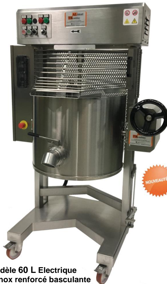
Modèle 60 L Electric Cuve inox renforcé basculante par volant avec poignée