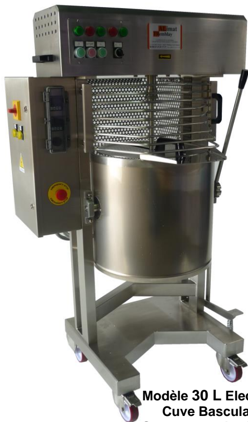
Modèle 30 L Electric Cuve Basculante Sans vanne de vidange